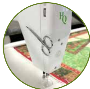
eingebauter Magnetstreifen für kleine Werkzeuge