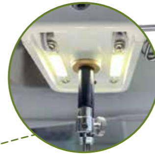
LED Licht in Durchlass- und Nadelbereich