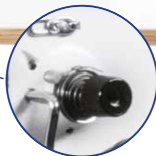
Easy-Set Tension™ (digitale Fadenspannung)