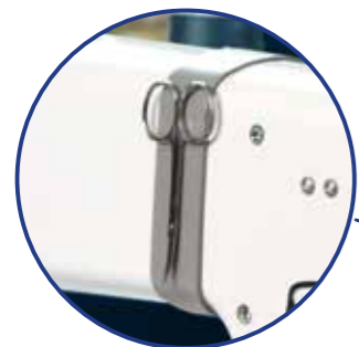
magnetischer Halter für kleine Werkzeuge*

Mit bis zu 2.500 Stichen pro Minute ist die AmaraST auch den fortschrittlichsten Quilttechniken gewachsen. Diese flexible und voll ausgestattete Maschine eignet sich perfekt für alle, die den Sprung ins Longarm-Quilten wagen. Sie ist aber auch fortschrittlich genug für professionelle Kunstquilterinnen.