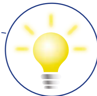
QuiltMaster™ LED-Beleuchtung: Durchlass, Nadelbereich und Spule